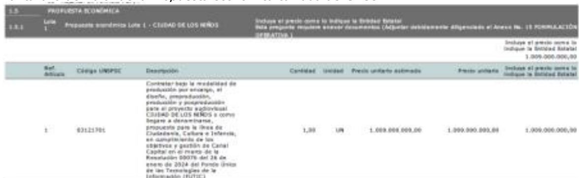
Pantallazo del valor de la Propuesta económica