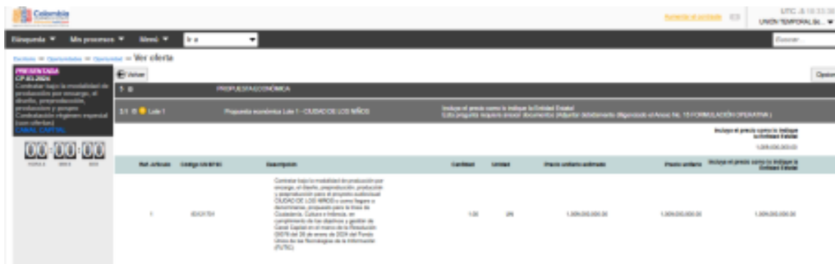
Pantallazo del valor de la Propuesta económica tomada del SECOP II

Se procedió a hacer la revisión pertinente, para determinar si por error humano se había cargado de forma inconsistente la información referida en la comunicación citada; encontrando que, tal como se evidencia en los pantallazos adjuntos, no se evidencia discrepancia entre el presupuesto propuesto por la entidad para el proceso, y la propuesta presentada por nosotros como unión temporal. Se verificó nuevamente los valores aritméticos y las fórmulas del Anexo 15, sin lograr identificar tampoco falencia en los mismos.